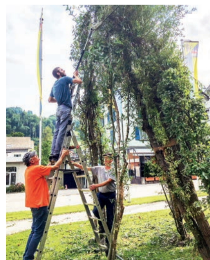
Einer der vier «Aktionstage fürs Klima»: Thema Weidepflege.

Einstein bildet den Leitgedanken des Experimentierlabors. Angeregt von der Arbeitgebervereinigung Ebnat-Kappel ist es dem Trägervereins Experimentierlabor und dem energietal toggenburg gelungen, das neue Angebot mit Pilotschulen in Ebnat-Kappel aufzubauen. Es bietet Schüler*innen der 3. bis zur 6. Klasse spielerischen Zugang zu technischen und naturwissenschaftlichen Themen und ermöglicht ihnen über das Experimentieren frühzeitig mit der Berufswelt in Kontakt zu treten. Nach der Pilotumsetzung 2021 lässt sich das Experimentierlabor auch