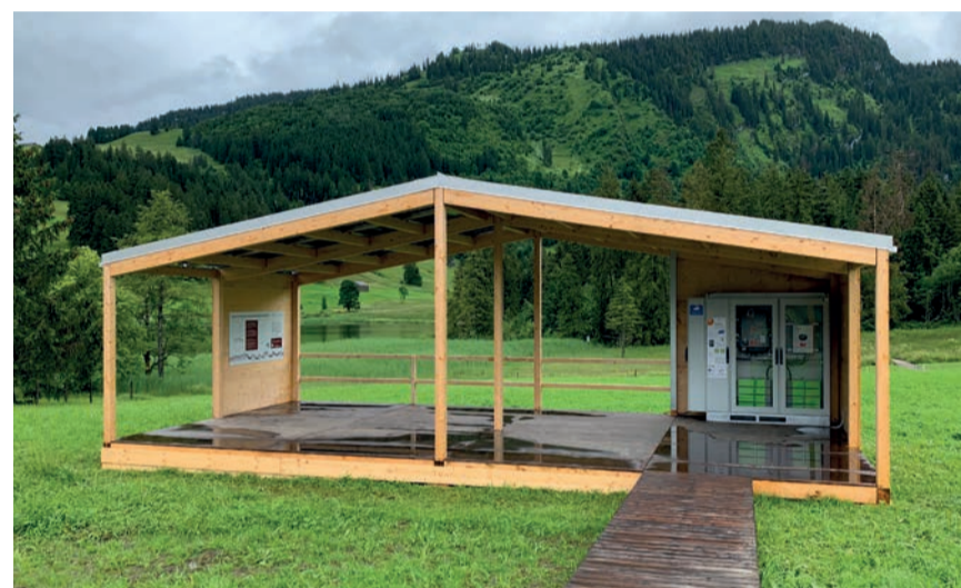
Erneuerbarer Energie lassen sich bei Events kaum nutzen. Mit dem mobilen Solarpavillon schliesst energietal toggenburg diese Lücke.

«Lernen ist Erfahrung. Alles andere ist nur Information.» Das Zitat von Albert