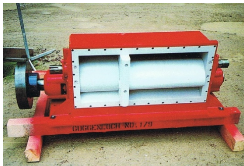
Die 130 kW Turbine vor dem Einbau.