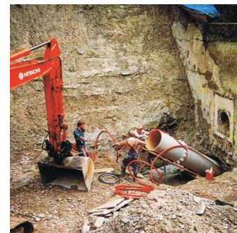
Bauarbeiten am Kraftwerk.