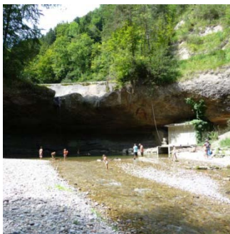
Umgebung des Kraftwerks im Guggenloch.